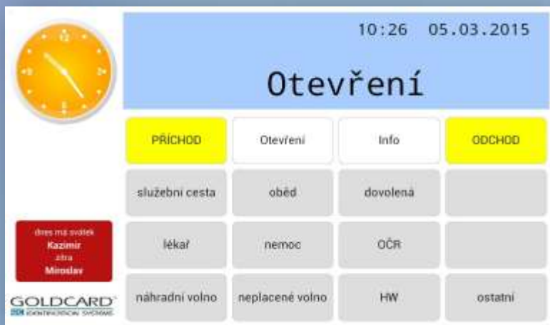
Hlavní panel docházkového terminálu